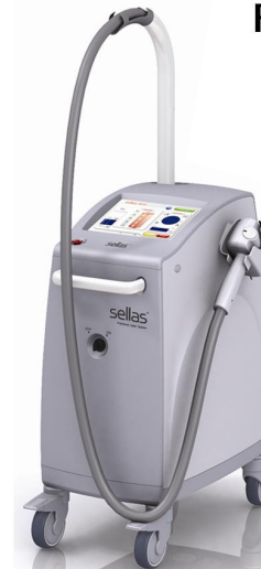
NAME: FRACTIONAL LASER 1550 BRAND: SELLAS - EVO MODEL: SELLAS - EVO