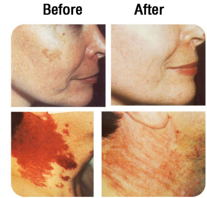
NAME: INTENSE PULSED LIGHT BRAND: Jeisys MODEL: Cellec