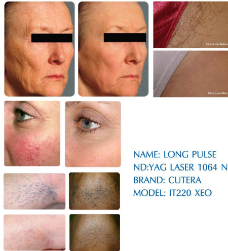
NAME: LONG PULSE ND:YAG LASER 1064 NM. BRAND: CUTERA MODEL: IT220 XEO