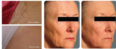
NAME: LONG PULSE ND:YAG LASER 1064 NM. BRAND: CUTERA MODEL: COOLGLIDE XEO