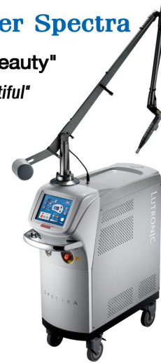
NAME: Q-SWITCHED ND:YAG BRAND: Lutronic MODEL: Spectra