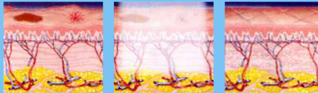
1. สภาพผิวที่มีปัญหาจุดต่างต่าง 2. แสงจะวิ่งเข้าตรงจุดที่มีปัญหา 3. เคลียร์ผิวให้กระจ่างใสในทันที